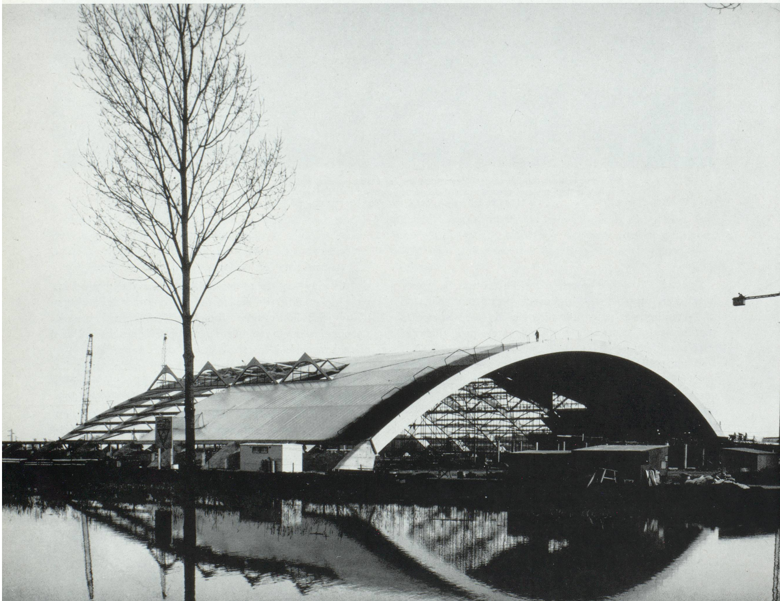
Hall d'exposition des Foires de Tours. Fabrication et montage en quatre mois.

En France, plus de 3 millions et demi de mètres carrés