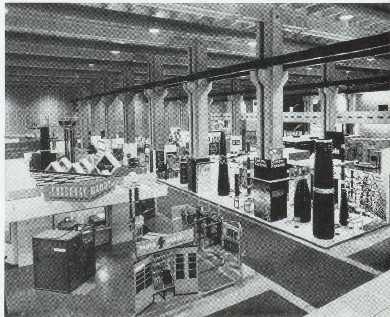
Dans le vaste rez-de-chaussée du nouveau bâtiment du Rosental, de volumineux objets d'exposition — sur cette illustration ceux de l'électrotechnique industrielle — sont mis pleinement en valeur.

Il peut paraître paradoxal que la Suisse, petit pays enclavé, situé sur la marge méridionale de l'Europe centrale et dans le bassin des fleuves européens les plus importants, soit fortement engagée dans l'économie mondiale. C'est pourtant cette situation peu ordinaire qui a donné naissance à un État hautement industrialisé. Le sol de l'Helvétie ne pouvant faire vivre sa population, une partie toujours plus grande de celle-ci est engagée dans l'industrie, les manufactures, le commerce, les services de transport et l'hôtellerie. Si l'on considère le revenu et la fortune de sa population, la Suisse se classe parmi les nations les plus favorisées. Sa prospérité est soigneusement entretenue par un instrument parfaitement au point et entièrement consacré à l'expansion économique du pays : la Foire Suisse d'Échantillons. Cette institution est une manifestation spécifique de