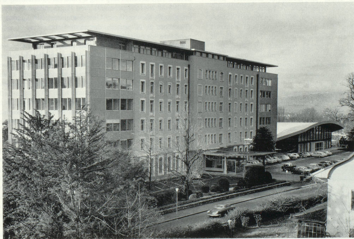
École polytechnique, bâtiment principal et bâtiment de l'Aula.

Directeur de l'École Polytechnique de l'Université de Lausanne