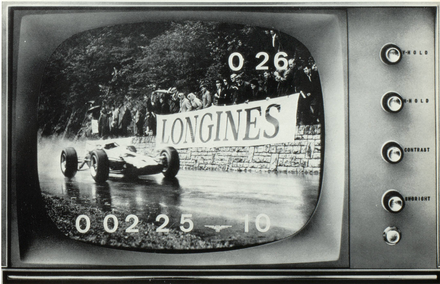
Compteur d'écran TV de Longines. Télolongines - Course de Côte St-Ursanne - Les Rangiers 1965 Jim Clark (photo-montage).