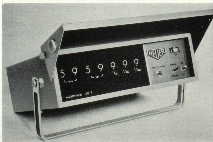
Un nouveau compteur de temps électronique, le « Microtimer » de Heuer-Léonidas S.A., mesure les millisecondes.

Les manifestations sportives occupent une place importante dans les programmes de télévision. Il est certain que le petit écran a popularisé le sport en drainant des foules considérables que l'éloignement des stades et les obligations familiales privaient d'un spectacle de choix. Conscientes de l'importance de ce phénomène, Omega et Longines ont réalisé des appareils destinés à faciliter le travail des commentateurs sportifs et à décupler l'intérêt des téléspectateurs. C'est ainsi que grâce à « l'Omeoscope » et à la « Télélongines » on peut lire sur l'écran les temps de chaque concurrent du départ à l'arrivée d'une course,