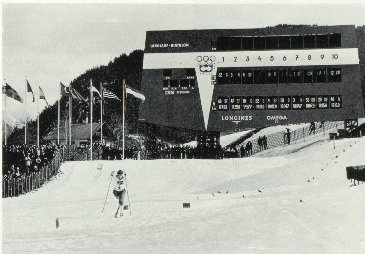
Jeux Olympiques d'Innsbruck 1964. Le tableau d'affichage géant était une des innovations présentées à Innsbruck. Les temps d'arrivée étaient automatiquement affichés dans l'ordre du classement des coureurs.

L'œil du « Photosprint » d'Omega et du « Contifort » de Longines, pour ne prendre que ces deux exemples d'appareils, est une fente verticale de moins d'un millimètre de largeur pointée exactement dans le prolongement de la ligne d'arrivée. Derrière cette fente se déroule un film à une vitesse réglée par rapport à celle des concurrents et qui enregistre tous les évé-