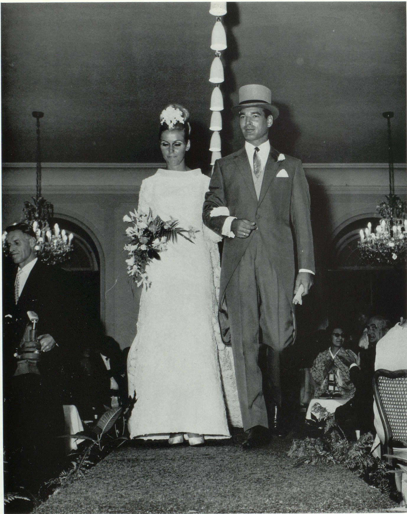
Robe longue de mariée broderie découpée blanche. Broderie Forster, Willi et Cie, St-Gall. Cutaway soie shantung. Tissu : Weisbrod-Zürcher S.A., Hausen.