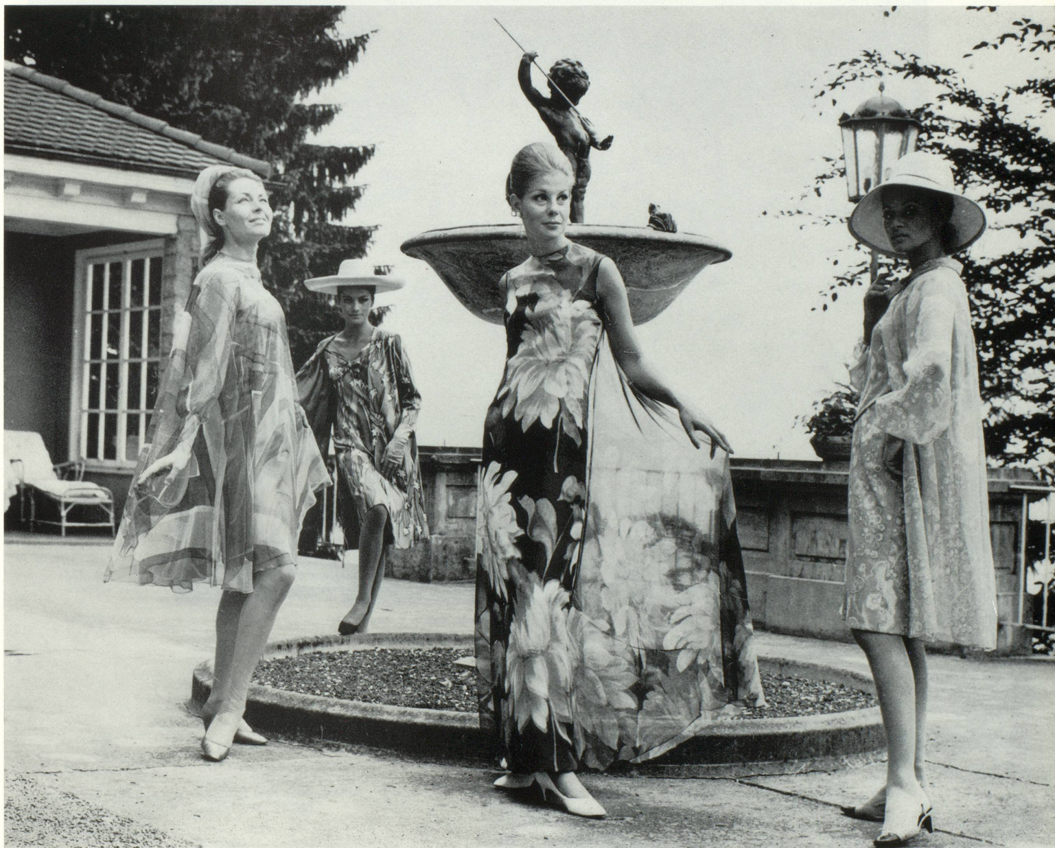
Second modèle depuis la gauche : robe et manteau en coton impression à main. Tissu Mettler, St-Gall.

Nous passons, ci-après, quelques séquences de cette importante manifestation.