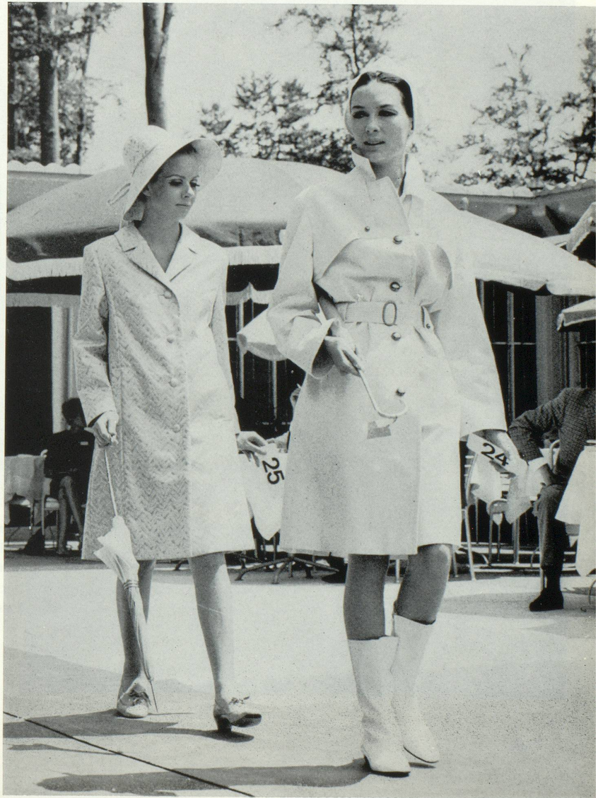
A gauche : Imperméable pour dames, jacquard beige et mordoré. Jacquard tout coton Stoffel : Stoffel S.A., St-Gall.