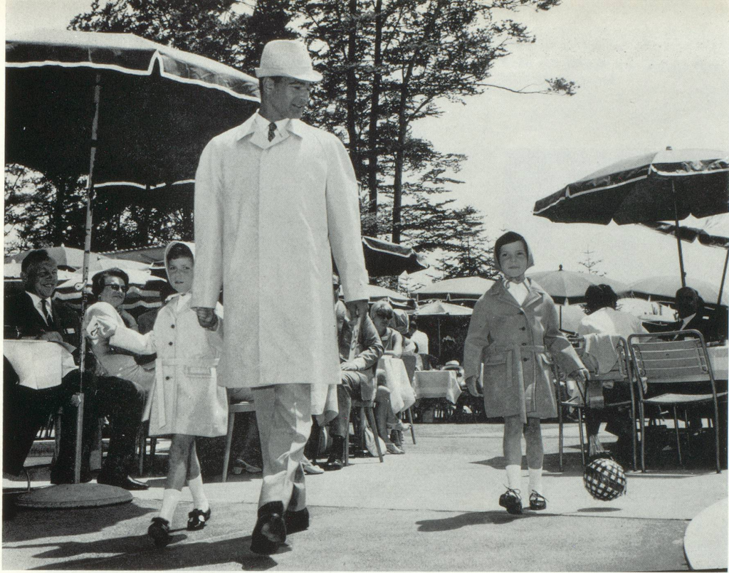
A gauche et à droite : Imperméable rose et orange pour enfants.