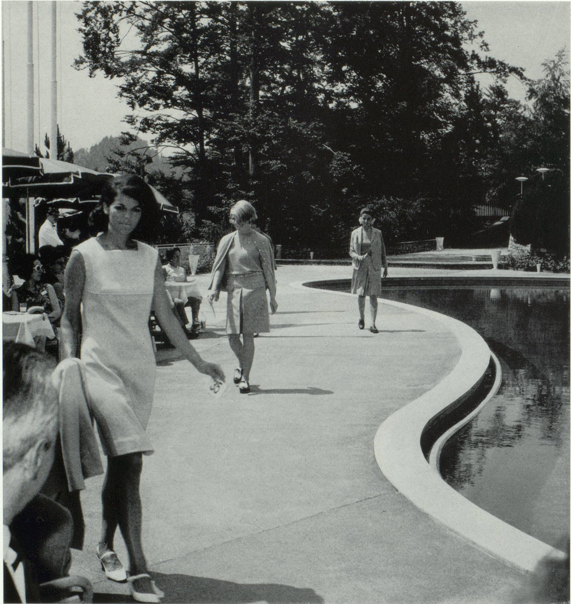
Robe et veste jersey laine tricoté bleu et blanc, dessin tweed. Modèle et jersey Hanro : Handschin et Ronus S.A. (Hanro), Liestal.