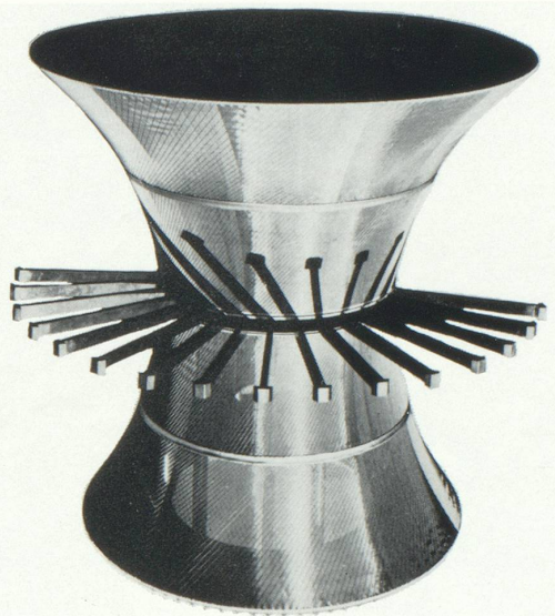
Antenne contre-rotative : Antenne à communication électronique étudiée sous contrat C.N.E.S. Elle est destinée aux satellites de télécommunication stabilisés par rotation sur orbite équatoriale.

« qualité spatiale » analogue à la « qualité nucléaire » font de la recherche spatiale un puissant facteur de stimulation et de développement dont tous les secteurs de l'économie sont amenés un jour ou l'autre à bénéficier par transposition de techniques spatiales aux industries traditionnelles.