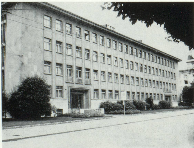
Siège de la Chambre suisse de l'horlogerie, La Chaux-de-Fonds.

Aucune activité économique autre que l'horlogerie ne pouvait mieux répondre aux conditions qui viennent