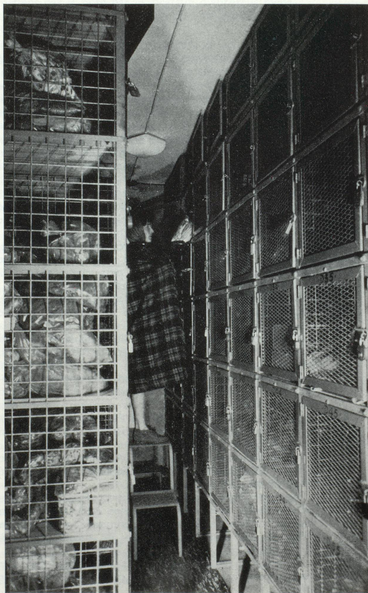
Congélateur collectif rural. Vue intérieure, casiers individuels (C.I.F., France).

En conclusion, l'évolution observée ces dernières années dans l'équipement frigorifique ménager est marquée par une double adaptation : adaptation à l'usager, suivant son mode de vie et ses besoins et adaptation également à la surgélation dont les produits rencontrent un indéniable succès dans tous les milieux.