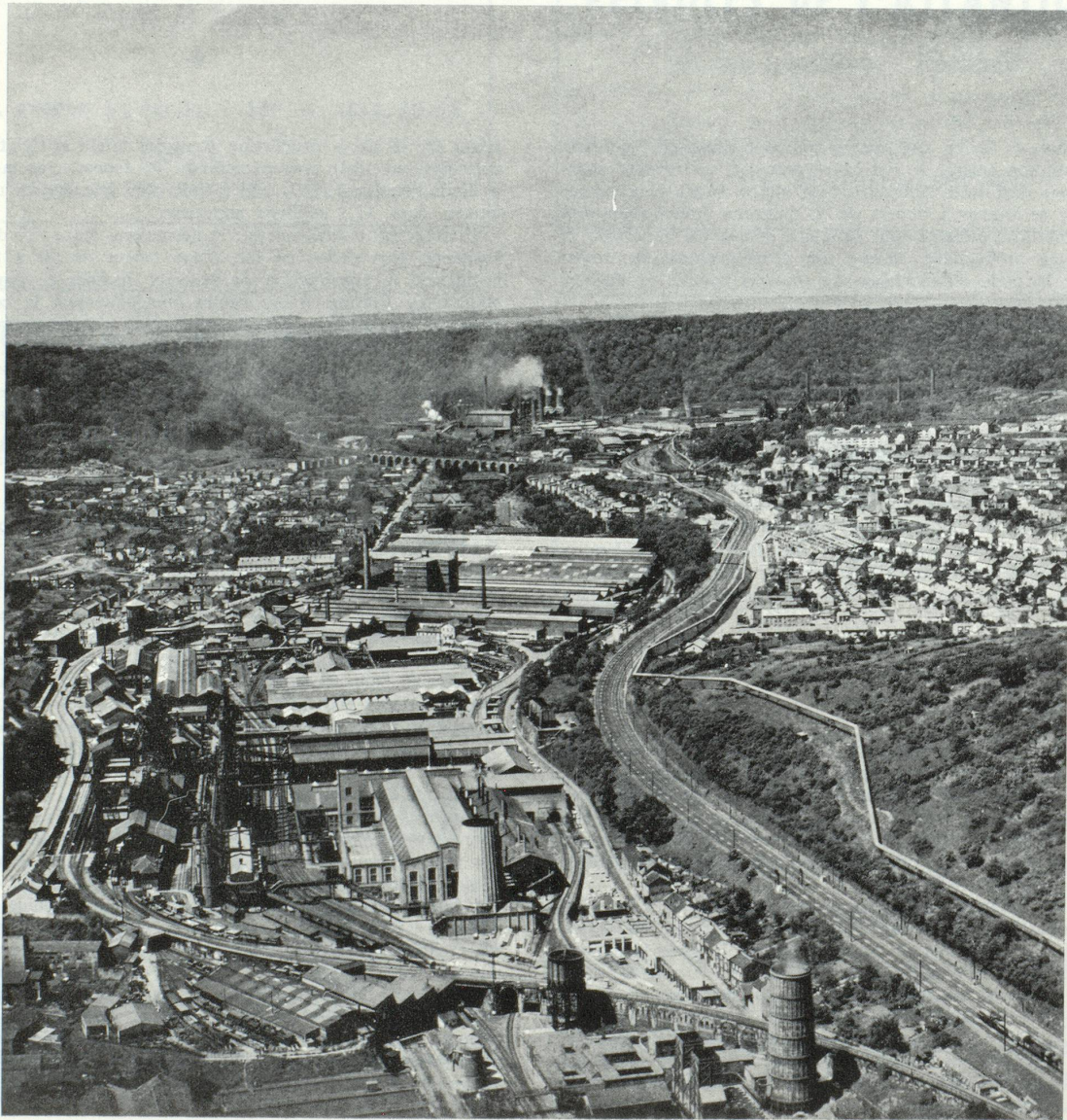
Fourneaux D. R. T. Saint-Jacques et Knutange.

A l'occasion de la modernisation et de l'agrandissement de leur appareil de production, les sociétés lorraines ont découvert à temps les avantages de l'action commune. Bien entendu, les entreprises ont amélioré leurs propres installations de production ; mais lorsqu'il s'est agi d'installer en Lorraine un laminoir moderne pour des produits plats, elles s'unirent sous la conduite du Groupe de Wendel et fondèrent la Société « Sollac », Société lorraine de laminage continu. La Société Sollac qui fêtera en décembre ses 20 ans d'existence, s'est fortement développée entre temps. Elle n'a pas seulement développé ses installations de laminage à chaud et à froid et de traitement de la tôle, mais construit également ses propres aciéries. Sollac dispose aujourd'hui d'un capital de 550 millions de francs français, elle produit 2,7 millions de tonnes de tôle laminée à chaud et 2,35 millions de tonnes d'acier brut. La production de tôle doit être portée à 3 millions de tonnes en 1970.