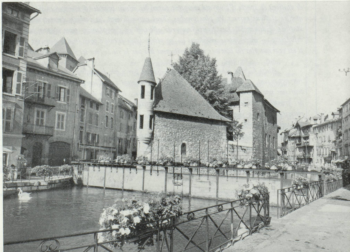
Annecy (Document de l'Association Départementale Haute-Savoie)