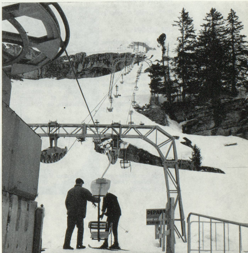
Flaine — Télésiège du Balacha (Document du Commissariat Général au Tourisme)

Grivols : Il est sur le lac d'Anniviers à 1500 mètres d'altitude. C'est un endroit très agréable. On peut faire de la randonnée, de la chasse, de la pêche, etc.