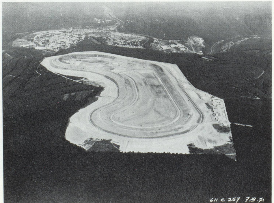
Revin : vue du bassin supérieur au cours des travaux

Pour réaliser le plus économiquement possible cet indispensable équilibre consommation/production, on dispose à côté de moyens dits « lourds » (nucléaire, thermique A, etc.) conçus pour un fonctionnement continu, de moyens légers et souples (usines hydrauliques, turbines à gaz, usines d'accumulation d'énergie par pompage hydraulique, etc.) destinés à fonctionner un nombre d'heures moindres et capables d'intervenir rapidement pour faire face aux brusques variations de charge du réseau.