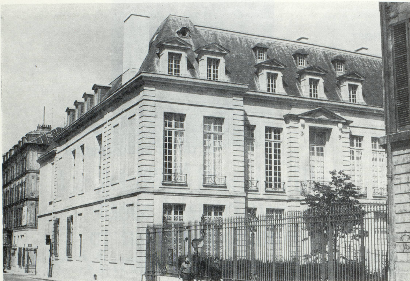
60, rue des Archives, Hôtel de Guénégaud restauré de 1966 à 1968 Le premier hôtel remis en état sur les prescriptions du Plan de Sauvegarde Un garage est construit sous le jardin

cinq siècles d'architecture urbaine. Il est encore l'un des seuls quartiers de Paris qui ait gardé une précieuse ambiance humaine.