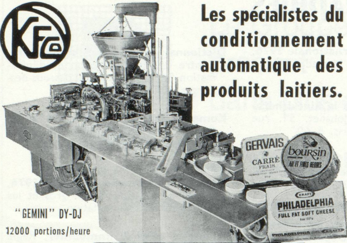
"GEMINI" DY-DJ 12000 portions/heure

Les spécialistes du conditionnement automatique des produits laitiers.