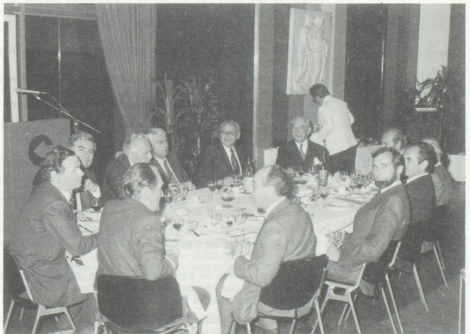
Vue de la table d'honneur.