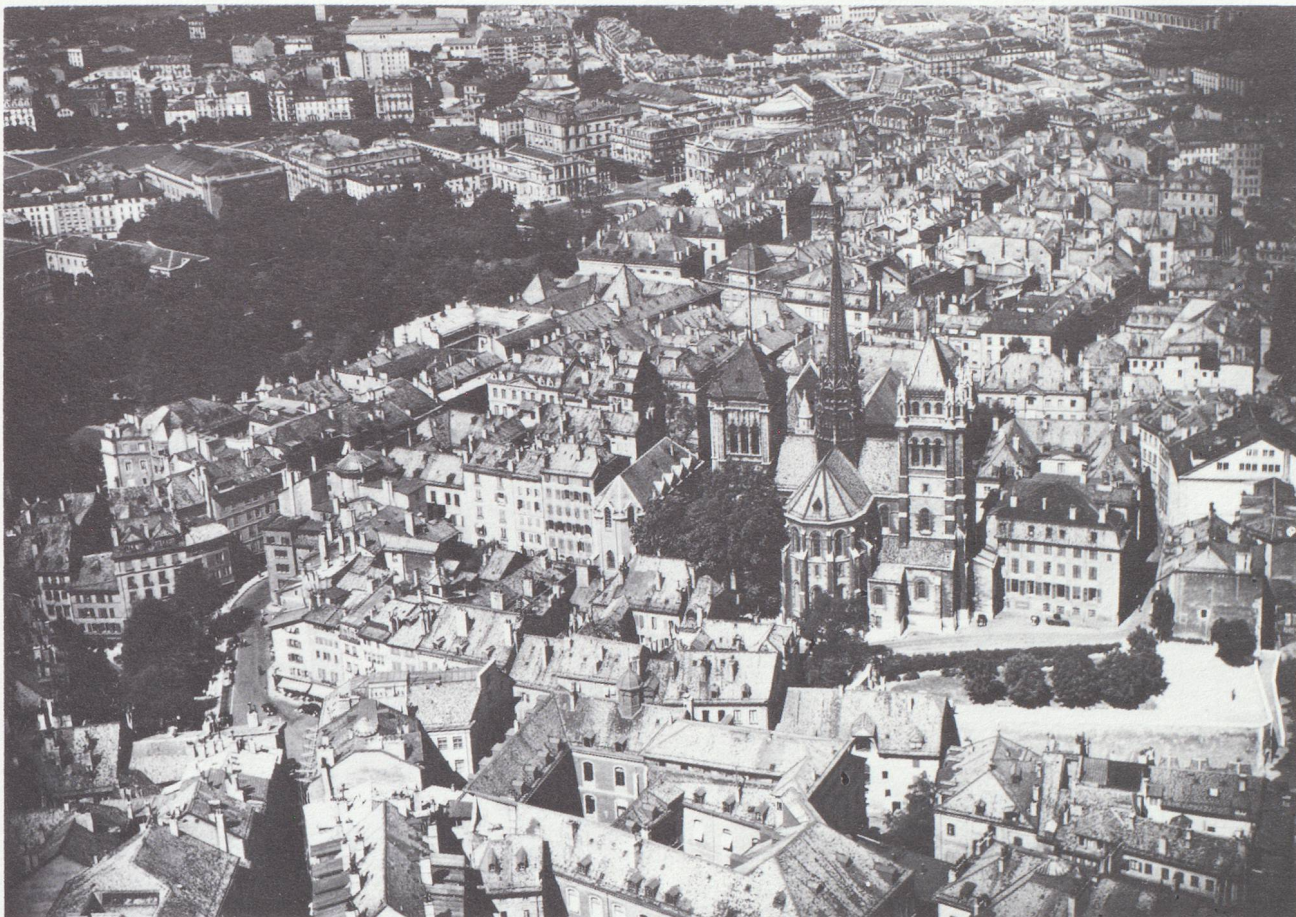
Genève : vieille ville avec Cathédrale Saint-Pierre.

explique les difficultés auxquelles il est actuellement confronté. C'est l'industrie métallurgique et la fabrication de machines et d'appareils qui représentent les branches les plus importantes de ce secteur. Viennent ensuite le bâtiment et le génie civil, les industries de l'alimentation et du tabac, les arts graphiques et l'industrie chimique. Les effectifs de cette dernière branche augmentent rapidement, deux grandes entreprises genevoises continuant à jouer un rôle de premier plan sur le marché mondial, notamment dans la spécialité des parfums synthétiques, dont la quasi-totalité de leur production est exportée.