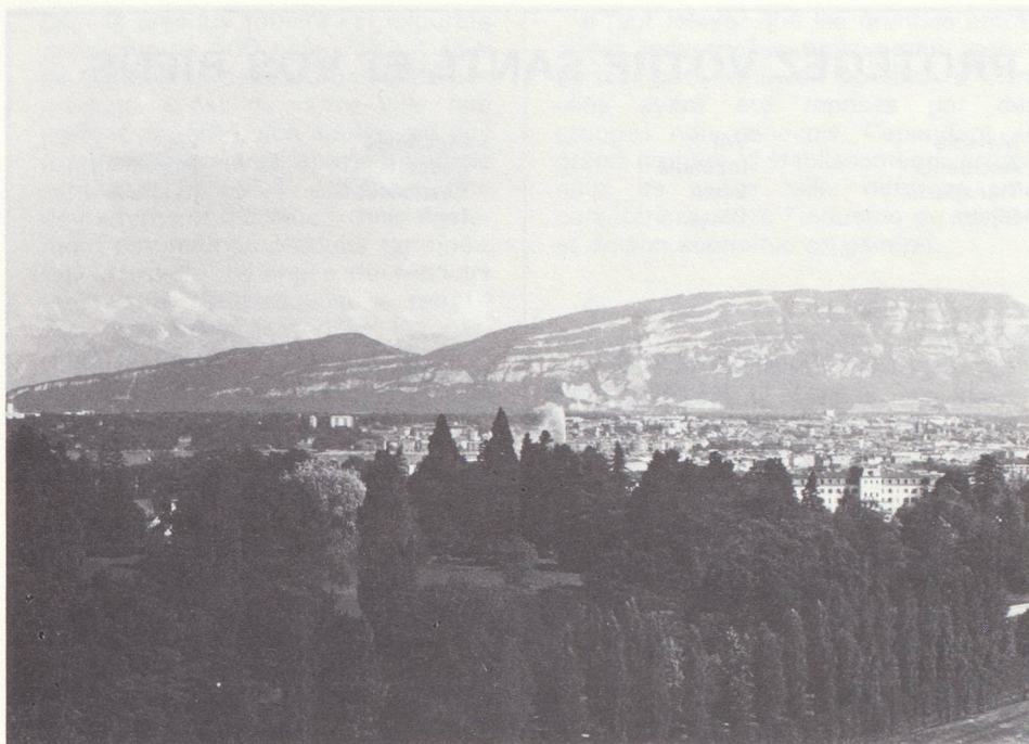
Campagne genevoise. Au fond : le mont Salève.

plus marquée à Genève que dans le reste de la Suisse. Le rôle de Genève et la place qu'elle occupe sur le plan international, de même que sa tradition commerciale et financière ne pouvaient qu'accélérer fortement cet essor du tertiaire, qui est indiscutablement la source la plus importante du développement de l'économie genevoise.