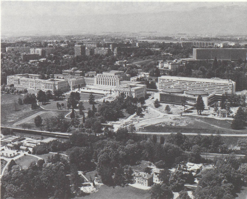
Vue aérienne du Palais des Nations, avec au fond le Lac Léman.

Troisième branche importante du secteur tertiaire, l'hôtellerie et le tourisme ont toujours joué un rôle de choix dans ce lieu de passage, d'échanges et de séjour qu'est Genève, favorisée par son appartenance à la