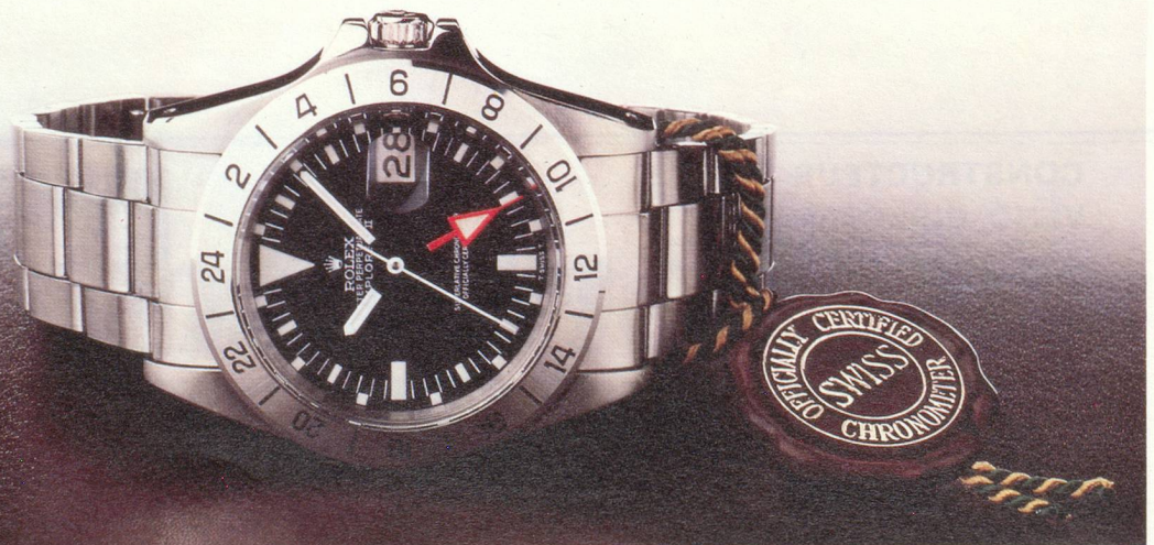
La Rolex Explorer II. Documentation sur demande à S.A.F. des Montres Rolex, 10, avenue de la Grande-Armée, 75017 Paris.

Une Rolex mérite le prestige dont elle jouit.