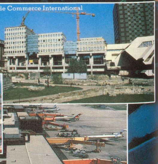
Marseille-Marignane, 2 e aéroport français.