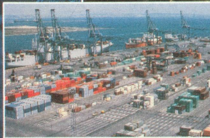
Marseille-Fos, 1 er port français.