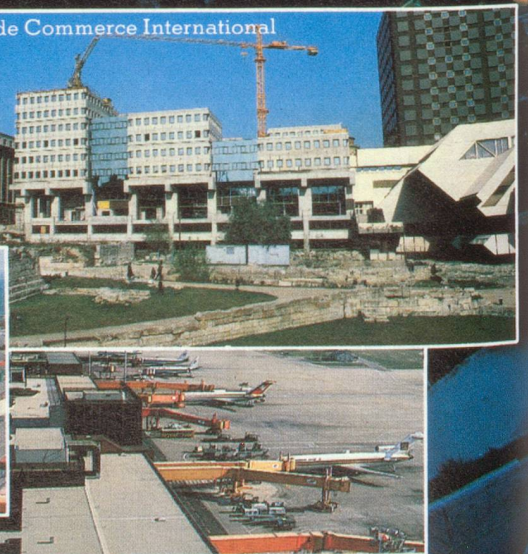
Marseille-Marignane, 2 e aéroport français.