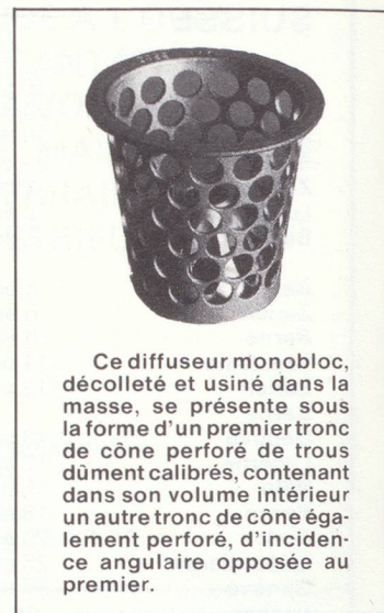
Ce diffuseur monobloc, décollé et usiné dans la masse, se présente sous la forme d'un premier tronçon de cône perforé de trous dûment calibrés, contenant dans son volume intérieur un autre tronçon de cône également perforé, d'incidence angulaire opposée au premier.

véhicules à essence commercialisés en Europe; qu'il s'agisse de modèle simple ou de carburateur double corps. Dans ce dernier cas, il vous faut deux ES.22.