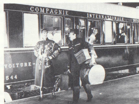
et tel qu'il se présentera aux voyageurs le jour de son voyage inaugural.

Premier départ le 28 mai 1982. Prix du trajet Paris-Venise: FF 2 200.