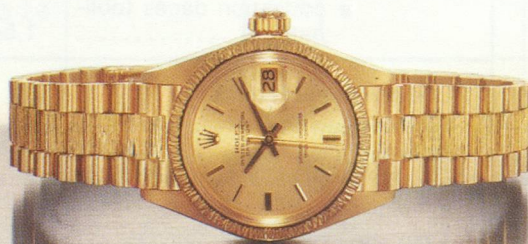
La Rolex Lady-Datejust. Documentation sur demande à SAF des Montres Rolex, 10 avenue de la Grande-Armée, 75017 PARIS.

Une Rolex mérite le prestige dont elle jouit.