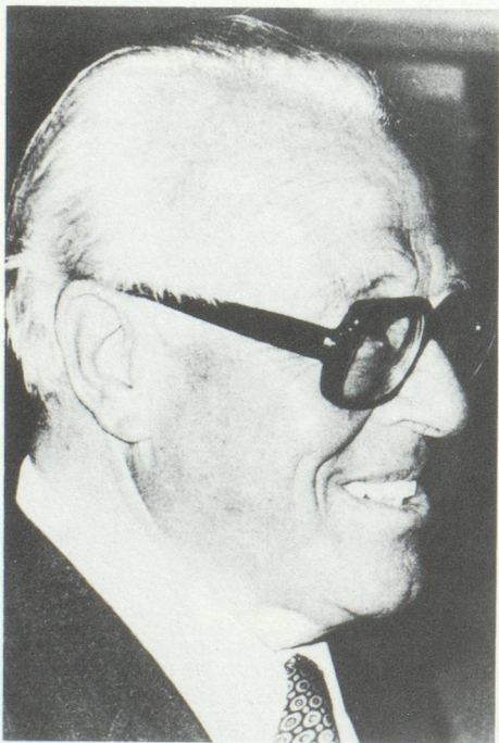
M. Pierre Graber, Ancien Président de la Confédération helvétique.