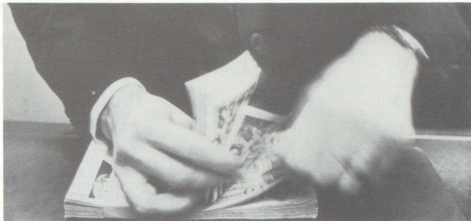
... Le secteur bancaire, boursier et des assurances est l'une des branches exportatrices suisses les plus performantes de l'économie....

La place financière suisse et, partant, la métropole financière de Zurich ne sont pas sans subir des attaques. En politique intérieure, ce sont les partis de gauche et, depuis peu, également certains milieux religieux qui se sont