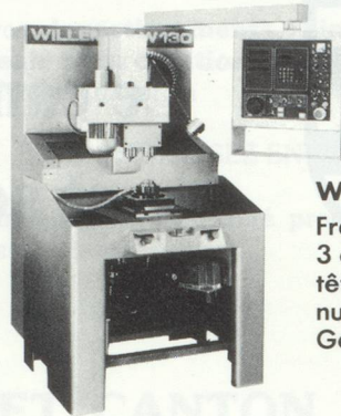
W-130 Fraiseuse de production, 3 ou 4 axes, variantes de têtes d'usinage, commande numérique NUM, Bosch, General Electric