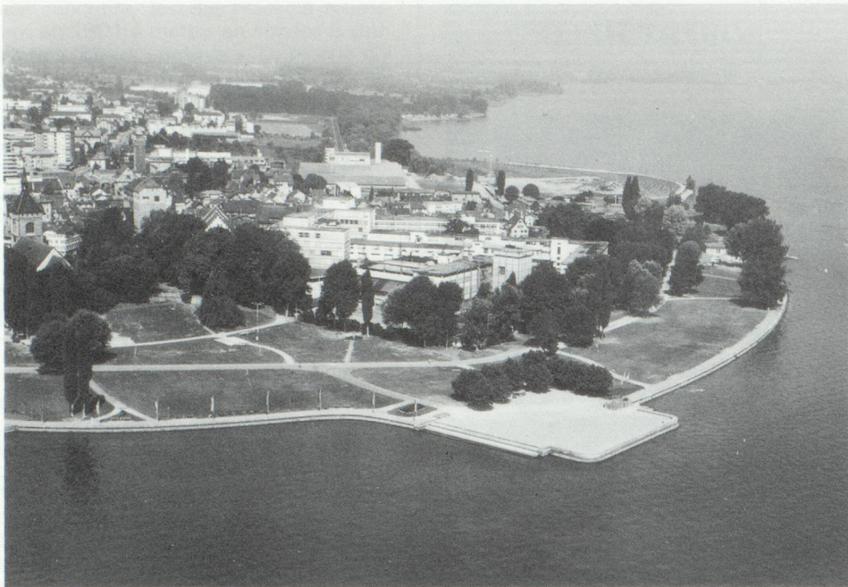
...La Thurgovie : un canton champêtre hautement industrialisé et fortement orienté vers l'exportation (Photo ci-contre : Arbon, ville industrielle sur le Lac de Constance).

vestimentaire. L'industrie mécanique suivit rapidement. Textiles et vêtements avaient, il y a peu de décennies encore, une place prédominante. Aujourd'hui ils sont dépassés par l'industrie mécanique et les appareils industriels. En outre, l'industrie de l'alimentation est fortement implantée. Elle se sert surtout des produits agricoles. Un certain nombre de secteurs de l'industrie du bois sont également fortement représentés.