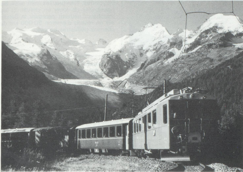
... Une formation du Bernina-Express, sur une partie de la voie ferrée la plus haute d'Europe...

fédéraux suisses (CFF) et les chemins de fer privés sont complètement électrifiés ; leur réseau d'environ 5 000 km comprend 3 600 km à voie normale et 1 400 km à voie étroite. Le matériel roulant a été renouvelé en majeure partie au cours des dernières années. Les grandes voies de communication à travers les Alpes – lignes du Saint-Gothard, du Simplon et du Lötschberg – assurent aujourd'hui un trafic de pointe très dense.