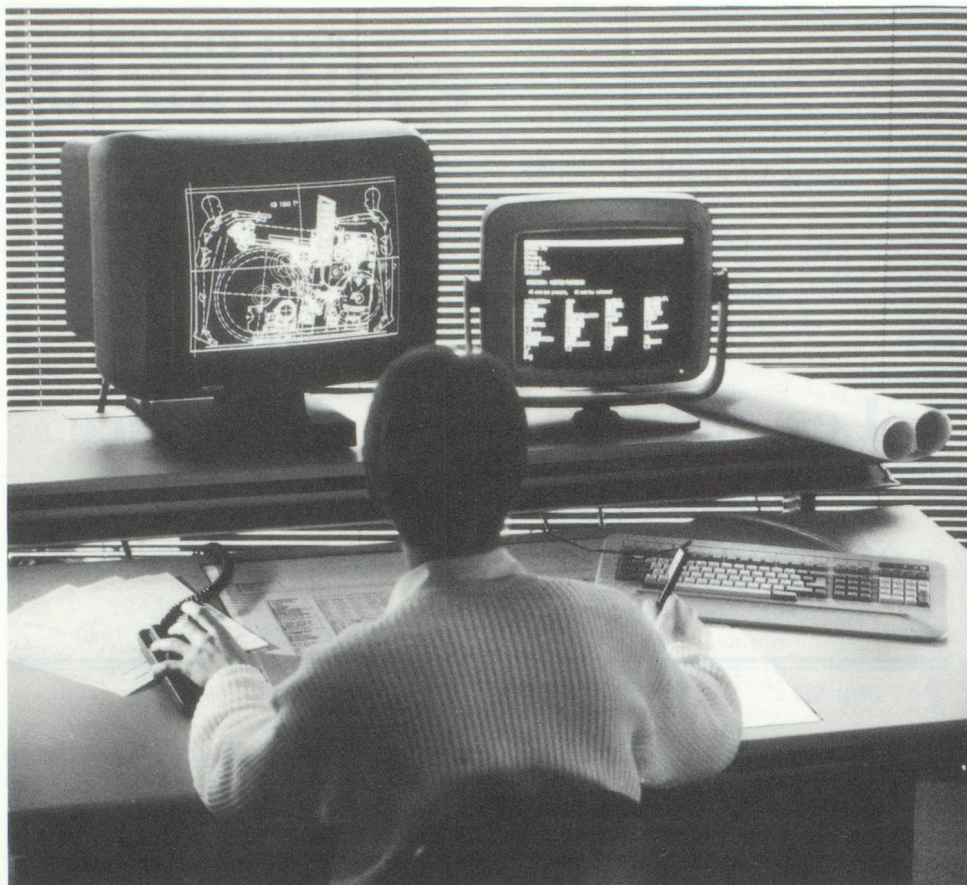
Conception assistée par ordinateur (C.A.D.) pour le développement des métiers à tisser chez Sulzer (Winterthur).

En fait, l'industrie suisse des machines est une branche latérale de l'industrie textile. Certes, beaucoup d'entreprises, à partir de la seconde moitié du siècle dernier, se sont constituées sans