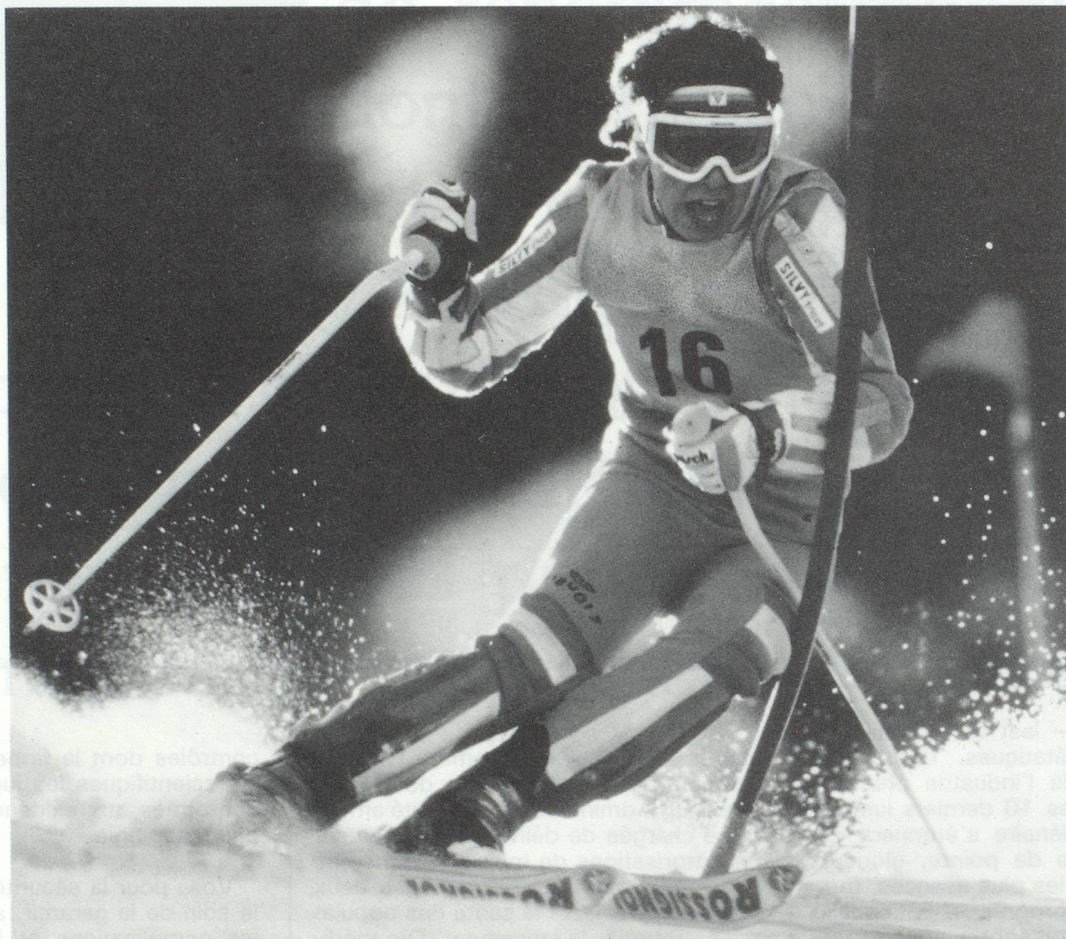
Vernier et Associés / Printel

La haute compétition est une lutte d'endurance pour les hommes et les matériaux. Une aventure commune où sportifs et chimistes partent sans cesse à la découverte de nouvelles performances.