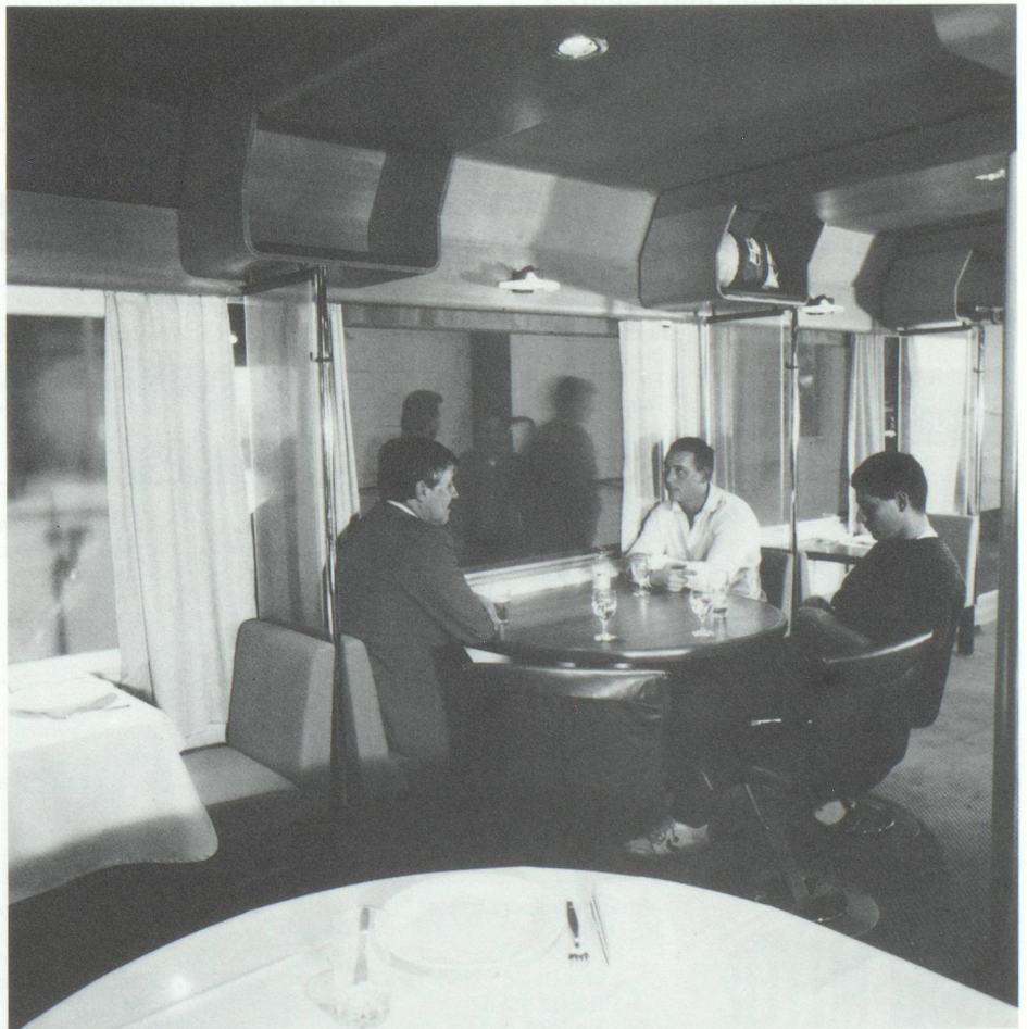
Vue intérieure du wagon-restaurant.