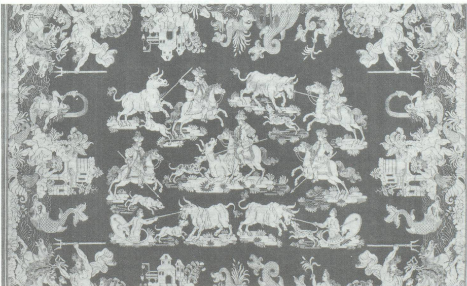
Serviette, Saxe, milieu du XVIII e siècle, lin et soie, damas, hauteur 115 cm, largeur 97 cm

Mechthild Flourey-Lemberg : Textile conservation and research , Fondation Abegg, 1988. Cette véritable somme, qui n'existe qu'en anglais et en allemand, rend compte de manière très vivante et pratique, de l'expérience accumulée pendant plus de 25 ans à la tête de l'atelier de conservation de la Fondation Abegg. Un modèle d'enthousiasme et de rigueur.