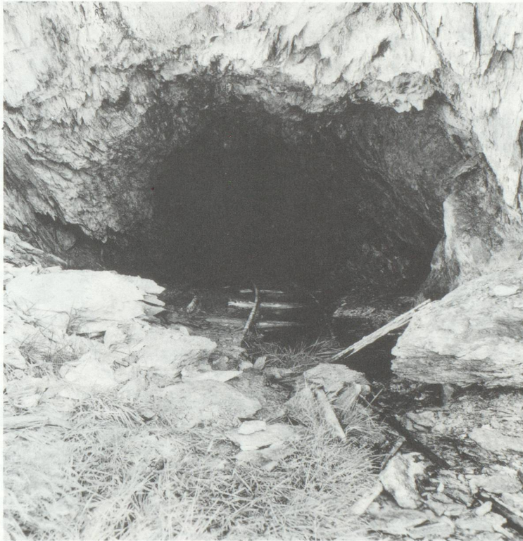
vestiges industriels dans les Alpes, mine de plomb, Goppenstein, Loetschental (Valais), 1989.

Alpes le bouleversèrent. La première fois que nous l'y emmenâmes, nous faillîmes le perdre sur le glacier, dans le brouillard. Ce fut la première de ses missions. Au fil des mois, il nous étonna par des images tout à fait inattendues, preuve que l'exploration de la montagne n'est pas faite, que la Suisse recèle encore des secrets, qu'on a donc bien tort de la résumer à ses autoroutes et à son béton trop arpentés.