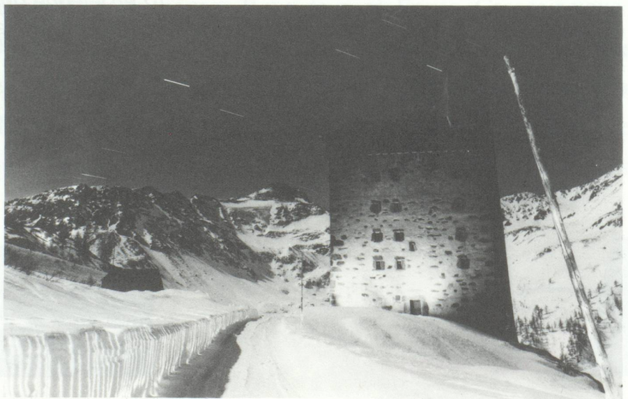
Ancien hospice, col du Simplon, 1990.

La montagne a longtemps constitué un défi insurmontable. Dès le XIX e siècle, les sommets sont vaincus, et les photographes rendent systématiquement compte de cette grandiose conquête. Il leur faut beaucoup de courage, d'énergie, de maîtrise technique. L'invention du procédé au collodion humide, en 1851, raccourcit le temps de pose. Mais le support est une plaque de verre, à la fois lourde à transporter et fragile à manipuler. Le recours au papier ciré réduit les difficultés, qui demeurent néanmoins gigantesques. Les pionniers de cette aventure sont surtout le Wurtembergeois, établi à Lausanne, Friedrich von Martens ; les Français Louis-Auguste et Auguste-Rosalie Bisson, deux frères, les premiers à avoir photographié le Mont-Blanc de près, ainsi qu'Aimé