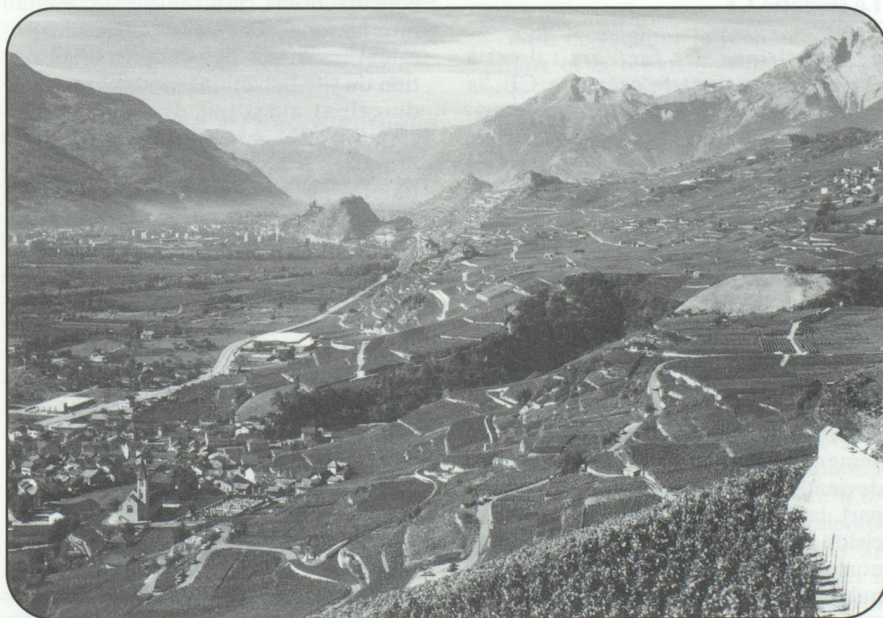
...L'agriculture suisse est sans doute l'exemple le plus patent de protectionnisme actif. Les coûts de cette politique pour le consommateur et contribuable du pays sont estimés à quelque 7 milliards de Francs suisses par an...

c) Branches apparentées et fournisseurs : les infrastructures publiques ont beaucoup de peine à s'adapter aux besoins de la demande ; en comparaison internationale, le réseau de chemins de fer est vieux et surchargé. Pour ce qui est des conditions de démarrage offertes aux nouvelles entreprises, la Suisse n'apparaît pas particulièrement progressiste par rapport aux autres pays. Les interventions suivantes de l'Etat exercent notamment un effet négatif sur la création et le développement de nouvelles entreprises assumant des risques élevés : la double imposition rend plus difficile l'acquisition de capital-