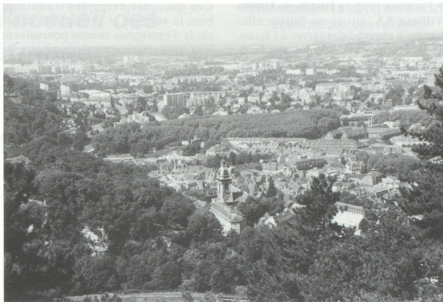
Vue générale de la ville de Besançon.

➔ En mars 1990, la Société Micro-Horlogère suisse ( SMH. ), numéro un mondial de l'horlogerie (Swatch, Omega, Tissot, Longines, Balmain), décide son installation à Besançon. La filiale française du groupe suisse a en effet acheté 4 000 mètres carrés de locaux qui abritent notamment les départements informatique et comp-