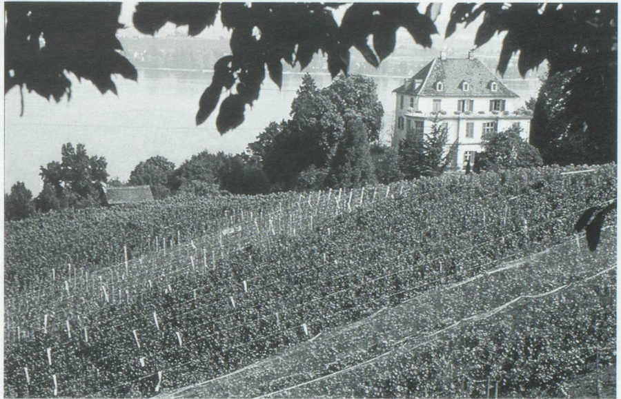
Vignobles d'Arenenberg dans le canton de Thurgovie

N ous ne pouvons parler de la situation de l'économie viti-vinicole suisse au tournant du millénaire sans faire mention des accords du G.A.T.T. Les dispositions mises en place dans le cadre de l'Uruguay-round impliquent un changement complet du régime d'importation des vins appliqué en Suisse depuis les années trente. En effet, le contingentement quantitatif rigide, qui est encore en place pour les vins blancs, devra être transformé en un contingentement tarifaire. Ce nouveau système permettra d'importer des volumes supérieurs à ceux impor-