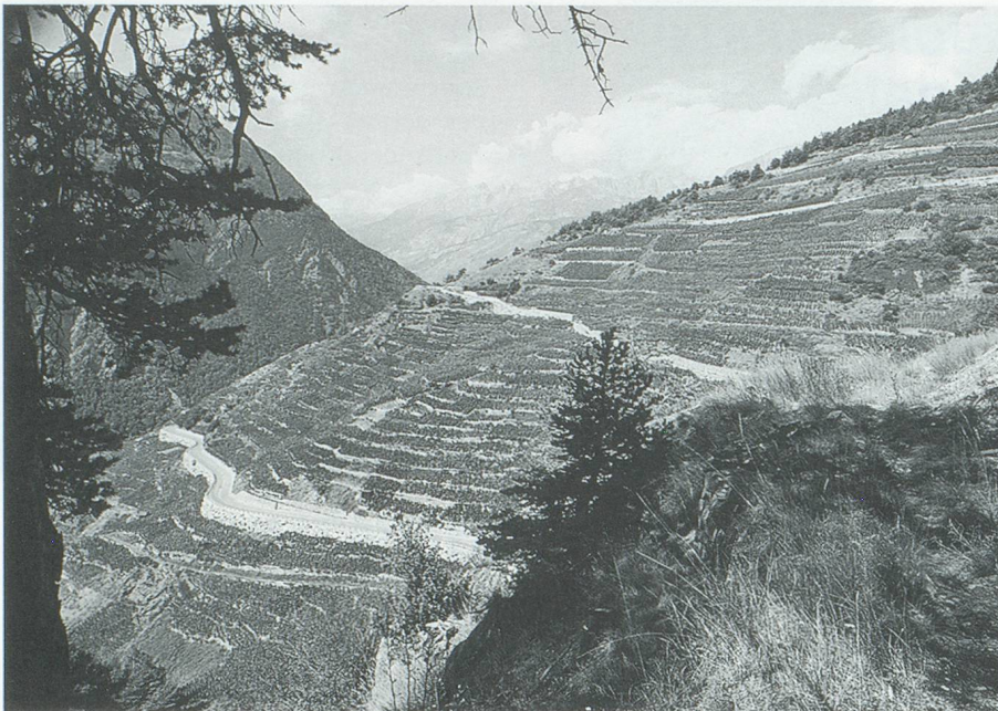
Vignoble de Visperterminen (Haut-Valais) © OPAV, Sion.