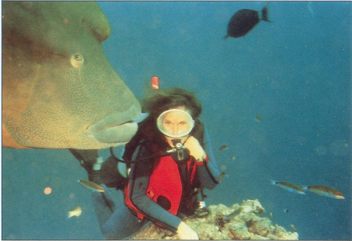
"Au fond des mers, ma Rolex est encore plus à l'aise que moi." Sylvia Earle.