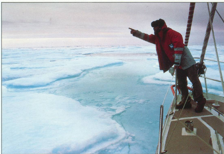
"Dans l'Arctique, une montre est l'équipement de survie de base." Janusz Kurbiel.

Au moment où vous lisez ces lignes, quelqu'un, quelque part dans le monde, s'aventure dans l'inconnu.