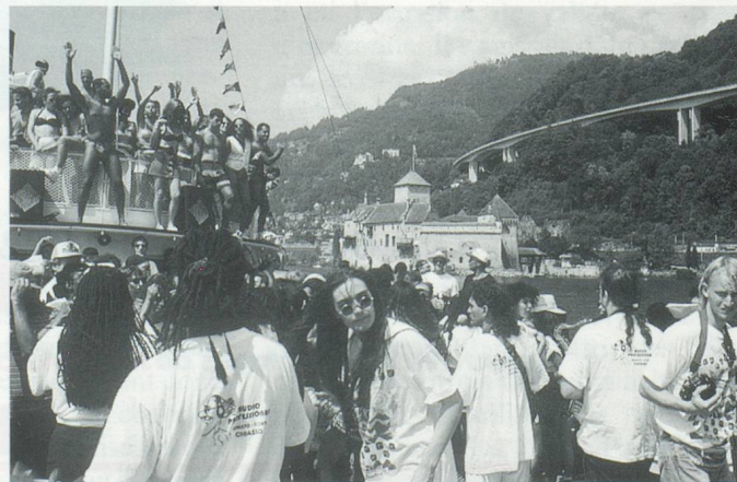
Bahia Boat 1995.

En trente ans, que de hauts-faits musicaux ont gravé dans les mémoires des traces indélébiles, contribuant à asseoir la renommée internationale non seulement du Festival, mais aussi de la ville de Montreux. Une liste rapide et non exhaustive des artistes en dit déjà assez long sur l'importance du rendez-vous : Santana, Bill Evans, Ella Fitzgerald, Roberta Flack, Aretha Franklin, Chuck Berry, Miles Davis, Cannonball Adderley, Sonny Rollins, Oscar Peterson, Count Basie... autant d'artistes qui ont tous décliné, avec plaisir, l'offre faite par Claude Nobs ou qui, spontanément, se sont présentés avec leur instrument sous le bras pour vivre une fois Montreux !