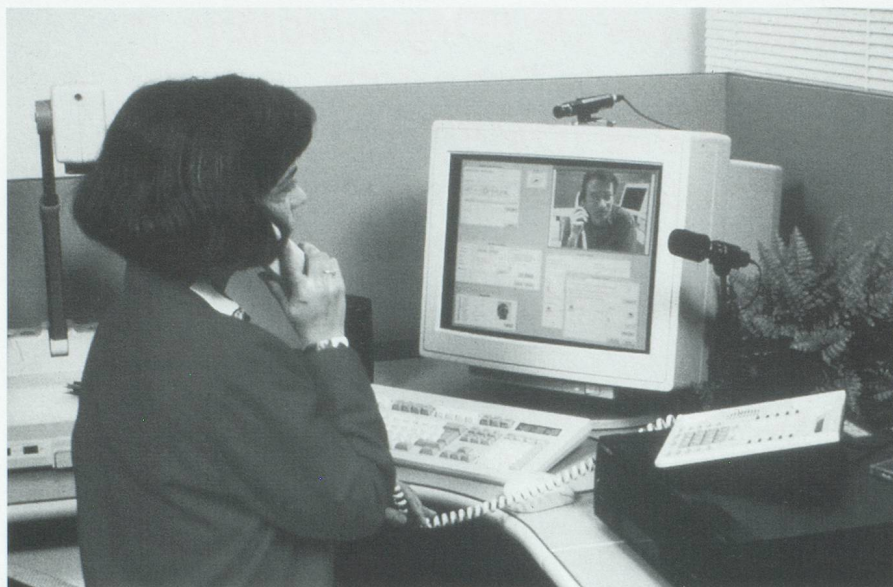
ATM : terminal multimédia Sonate (juillet 1994).

La numérotation et, d'une manière plus générale, un système d'identification des œuvres et des phonogrammes