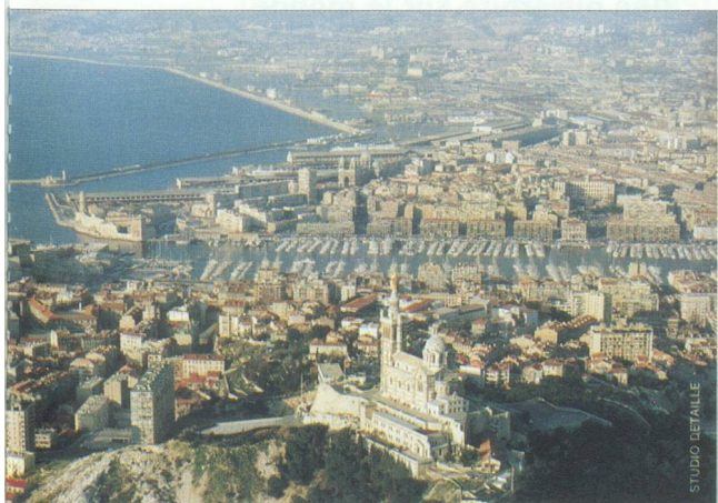
Marseille : la capitale des Bouches-du-Rhône mais aussi celle de la région PACA.

Le Bas-Rhône et les régions littorales, de Fos à la frontière italienne, concentrent 90 % des effectifs industriels. La région PACA arrive au 5 e rang des régions françaises en termes d'effectifs employés et de valeur de la production industrielle, après l'Ile-de-