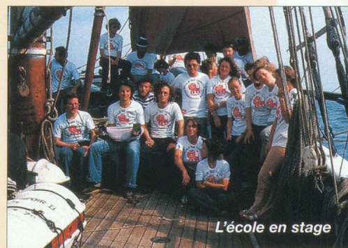
L'école en stage

culturel, car on ne peut parler et comprendre véritablement une langue sans connaître le contexte dans lequel celle-ci se développe. Par des programmes respectant les exigences de la vie pratique, par une pédagogie novatrice, par de très nombreuses visites - à caractère culturel ou professionnel - dans divers endroits de France, par l'immersion de ses élèves en milieu familial, par des possibilités de stage en entreprise, l'Ecole Suisse Internationale offre donc ce cocktail réussi d'un institut d'enseignement totalement ouvert au monde extérieur. Elle le prouve au fil des saisons par d'excellents résultats aux examens nationaux et internationaux (DEL/DALF, ou examens de la CCIP).