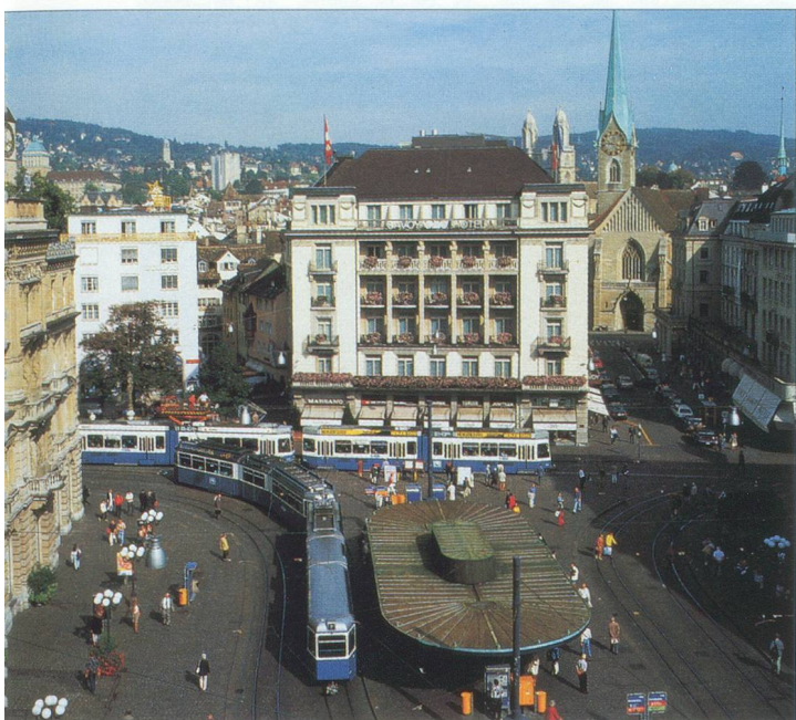
Zurich, capitale économique de la Suisse. Vue sur la Paradeplatz.