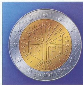
Face française des pièces de 2 euro.