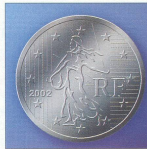
Face française des pièces de 10, 20 et 50 cents.

européenne. Les flux de capitaux seront proportionnels à la volatilité des monnaies des pays participants. Les sociétés de première qualité pourraient bénéficier par osmose de meilleures notations comme dans le reste de l'Europe. Les emprunts émis par ces entreprises verront donc leur prime de risque diminuer.