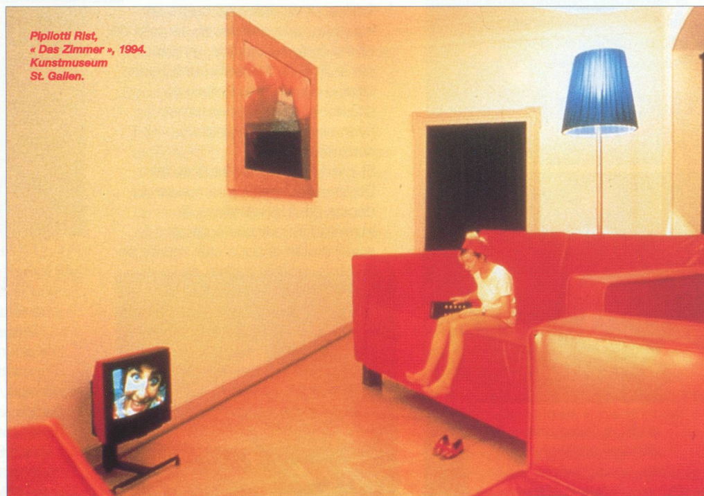
Pipilotti Rist, « Des Zimmer », 1994. Kunstmuseum St. Gallen.

pour son approche ouverte et optimiste de la création artistique ainsi que pour son amour des grands espaces d'exposition. Cette dernière condition étant largement réunie à la halle Tony Garnier, c'est le thème - un peu confus - de « l'autre » qu'il a choisi de mettre en avant. Bien décidé à remuer les idées reçues et à laisser une large place à l'humour, il mélange tous les genres. On y trouve donc une fascinante vidéo sur le genre humain par Gary Hill (USA), une installation pneumatique, sinieuse et transparente, de Serge Spitzer (USA), les bustes en bronze, illustrant la comédie des caractères, réalisés au 18 e siècle par l'Autrichien Franz-Xaver Messerschmidt (1736-1786), les chants de sirènes obsédants accompagnant un conte de fée télévisuel imaginé par Mariko Mori (Japon), des dessins hypnotiques réalisés selon les oscillations d'un pendule par la guérisseuse Emma Kunz (Suisse), une maquette du psychédélique palais du facteur Cheval