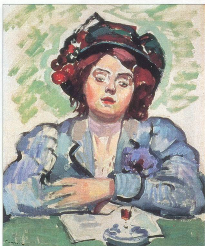
Charles Camoin (1879-1965), « La petite Lina », 1906.

Bercé depuis sa naissance (1879) par le soleil de Marseille, le jeune Charles Camoin monte à Paris âgé tout juste de vingt ans. Il y apprend la peinture et découvre la couleur en compagnie de Matisse, Marquet et Manguin dans l'atelier de Gustave Moreau. Quelques années plus tard, pendant son service militaire à Aix-en-Provence, il parvient à se lier d'amitié avec le solitaire Paul Cézanne qui lui prodigue ses conseils. Les tableaux de Camoin y gagnent en force et en rigueur. Exposant plusieurs toiles au Salon de 1905, il se retrouve emporté par la « déferlante » fauve avec Derain et Vlaminck ainsi qu'avec tous ses amis rencontrés chez Gustave Moreau. Il expose chez Kahnweiler, connaît des périodes sombres, correspond longtemps avec Marquet et Matisse, qu'il suit même à