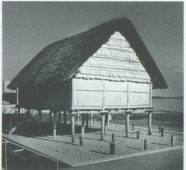
Site du nouveau musée - Reconstitution d'une maison de l'âge du bronze.

Confédération, soit par la « Fondation La Tène » que préside M. René Felber, ancien président de la Confédération, voire la commune de Hauterive qui, dans un élan d'enthousiasme, accepta de renoncer à toutes taxes de construction.