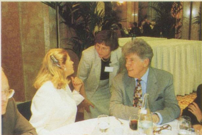
Un débat qui se poursuit bien après.