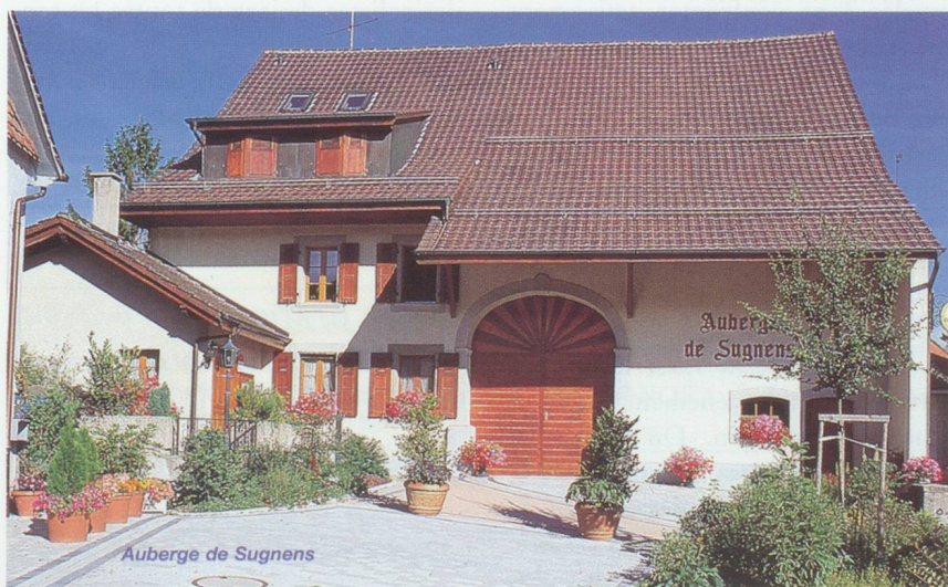
Auberge de Sugnens