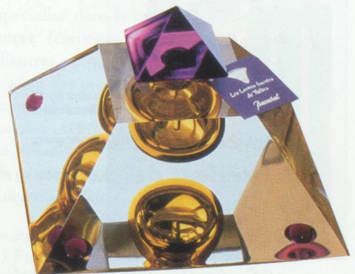
Parfum Baccarat : "Les Larmes Sacrées de Thèbes".

Là-aussi, la France occupe une place prépondérante sur ce marché. Selon le Cerna, 74 % du chiffre d'affaires est réalisé à l'export. Une étude publiée en 1995 par Les Echos estimait le chiffre d'affaires réalisé par l'ensemble des acteurs de la profession à 60 milliards de FRF. En appliquant le chiffre retenu par le Cerna, soit 36,4 milliards de francs, on obtient un « segment luxe » correspondant à 61 % du marché français de la parfumerie-cosmétique.