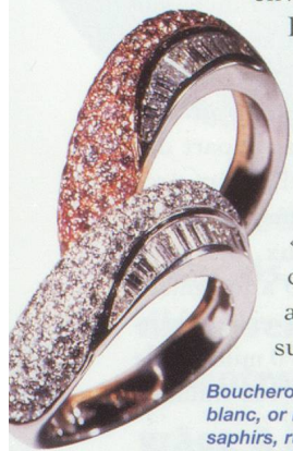
Boucheron Joaillier - Anneau "Sacha". Or blanc, or rose et or jaune avec diamants, saphirs, rubis ou émeraudes. © Boucheron Paris.

Il est peu aisé d'identifier le poids du luxe au sein de ce métier, ce d'autant que l'étude menée par le Cerna n'a pas intégré cette donnée. L'ensemble de l'industrie horlogère française représentait au total un chiffre d'affaires de 3,1 milliards de FRF en 1996. Le marché de la bijouterie-joaillerie est quant à lui estimé à environ 5,5 milliards de FRF. Notons que, depuis 1996, les acteurs présents sur le « segment luxe » ont créé des produits d'entrée de gamme « plus abordables » ; cette nouvelle stratégie a eu des effets positifs sur leur chiffre d'affaires.