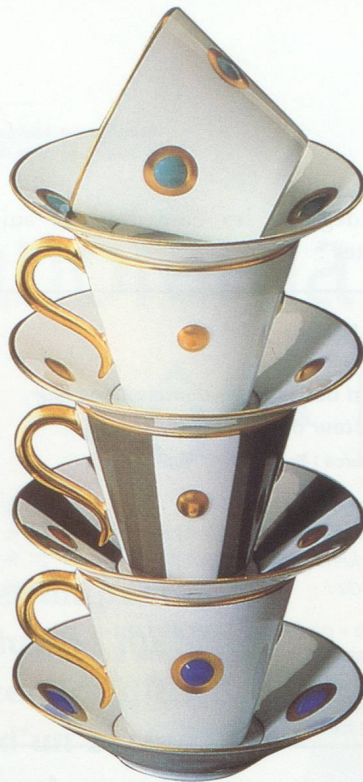
Bernardaud - Collection "Ithaque" et "Lipari" © Bernardaud.

Comme les autres secteurs du luxe où la France détient une position de leader, une forte partie du chiffre d'affaires des marques françaises de maroquinerie est réalisée à l'export (79 %). Ce secteur se différencie par ailleurs des autres par la part importante du luxe par rapport au secteur dans son ensemble. Cependant, même si la France domine encore ce marché, elle est fortement concurrencée par les marques italiennes. Il s'agit en outre d'un secteur particulièrement concentré, les acteurs majeurs au niveau français étant LVMH et Hermès.