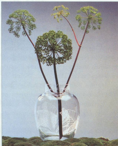
Baccarat : Vase aux feuilles - Collection « Les botaniques » créée par Christian Tortu.