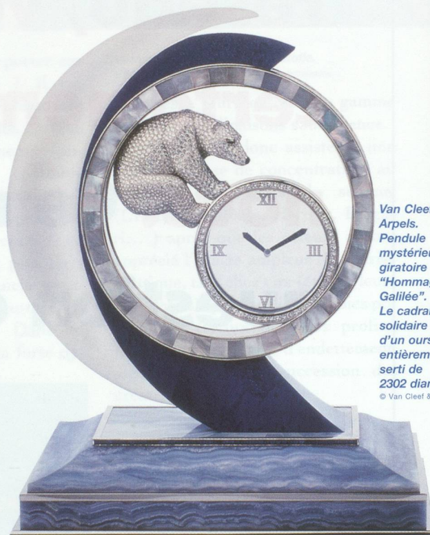
Van Cleef & Arpels. Pendule mystérieuse giratoire "Hommage à Galilée". Le cadran est solidaire d'un ours entièrement serti de 2302 diamants. © Van Cleef & Arpels.

Dresser un panorama de l'industrie du luxe est un exercice difficile car il s'agit d'un secteur aux contours flous qui regroupe des métiers très différents. Si, côté français, nous avons la chance de disposer de données économiques récentes sur l'ensemble du secteur, grâce à l'étude du Cerna(*), réalisée en 1995 à la demande conjointe du Ministère de l'Industrie et du Comité Colbert, il n'en est pas de même pour l'industrie du luxe suisse. En effet, les informations disponibles concernent généralement un métier, l'horlogerie par exemple, et il s'avère très malaisé à l'intérieur de chacun de ces métiers d'isoler la part dévolue au luxe. Aussi avons-nous opté, comme vous le verrez ci-après, pour une approche différente de l'industrie française et suisse du luxe.