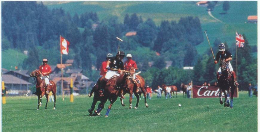
Match de polo à Gstaad.