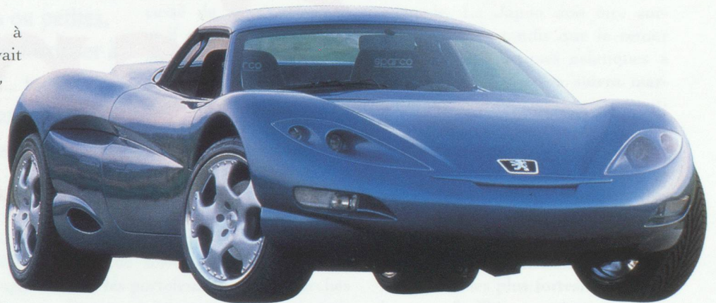
La Peugeot V6 Crisalys revue par Franco Sbarro.

Carrossier de génie, Franco Sbarro a non seulement habillé ses véhicules de manière originale mais il a innové dans des domaines de la technique automobile (invention en 1989 de la roue orbitale, par ex.). Au sommet de son art, Franco Sbarro a souhaité transmettre son