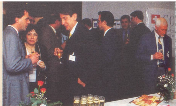
Les nombreuses manifestations de la CCSF Grand-Est rencontrent toujours un grand succès

Th.B. : Ce n'est un secret pour personne : la CCSF procède