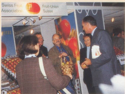
Son Exc. M. Bénédicte de Tscharnern, Ambassadeur de Suisse en France (à droite) en entretien avec l'un des exposants.

L'Office suisse d'expansion commerciale (OSEC) a organisé à nouveau cette année, en partenariat avec la Fédération des industries alimentaires suisses (FIAL), une section officielle suisse au Salon International de l'Alimentation au Parc des Expositions de Paris-Nord Villepinte, en banlieue parisienne. C'est ainsi que, du 18 au 22 octobre, plus de 20 entreprises, leaders sur le marché suisse, ont utilisé cette plate-forme scindée dans deux halls (l'un consacrée à l'alimentation et produits d'agrément ; l'autre aux fromages et produits laitiers). Les produits exposés couvraient de multiples domaines comme les aliments naturels, le fitness food, le safety food, les aliments fonctionnels et organiques ainsi qu'un grand nombre de produits prêts à l'emploi (rôsti, fondues par ex.). Son Exc. Monsieur Bénédicte de Tscharnern, Ambassadeur de Suisse en France, a visité avec beaucoup