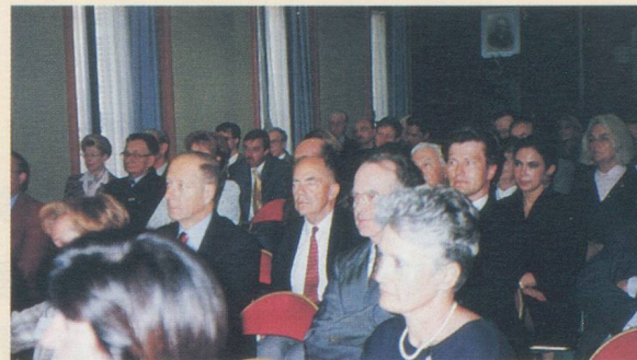
Un auditoire attentif pour les rencontres économiques.

R.C. : En organisant notamment ce que nous appelons des rencontres économiques. Elles se tiennent toujours dans nos locaux, rue d'Arcole. En 1997, l'une d'elles a été consacrée à l'euro et à ses conséquences pour la Suisse. Elle a obtenu un très grand succès puisque nous avons réuni quelque 120 personnes. Nous intervenons partout où on nous le demande. Récemment, nous sommes allés présenter la Chambre dans le cadre