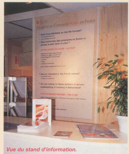
Vue du stand d'information.

L'Office suisse d'expansion commerciale (OSEC) a organisé à nouveau cette année, en partenariat avec la Fédération des industries alimentaires suisses (FIAL), une section officielle suisse au Salon International de l'Alimentation au Parc des Expositions de Paris-Nord Villepinte, en banlieue parisienne. C'est ainsi que, du 18 au 22 octobre, plus de 20 entreprises, leaders sur le marché suisse, ont utilisé cette plate-forme scindée dans deux halls (l'un consacrée à l'alimentation et produits d'agrément ; l'autre aux fromages et produits laitiers). Les produits exposés couvraient de multiples domaines comme les aliments naturels, le fitness food, le safety food, les aliments fonctionnels et organiques ainsi qu'un grand nombre de produits prêts à l'emploi (rôsti, fondues par ex.). Son Exc. Monsieur Bénédicte de Tscharnern, Ambassadeur de Suisse en France, a visité avec beaucoup