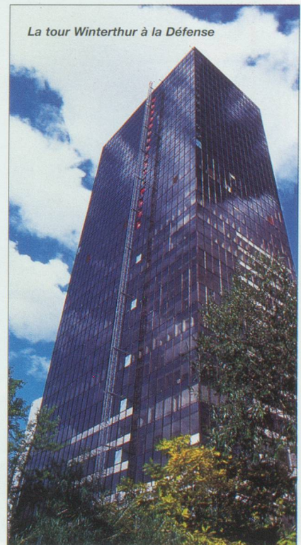
La tour Winterthur à la Défense