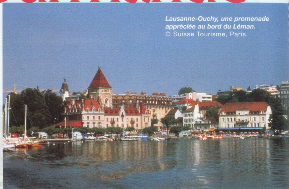
Lausanne-Ouchy, une promenade appréciée au bord du Léman.

Mini-métropole de la Romandie, siège olympique, elle est aussi le théâtre de grands congrès. Ses palaces (le Beau Rivage , le Lausanne-Palace ) ont fière allure. La vedette